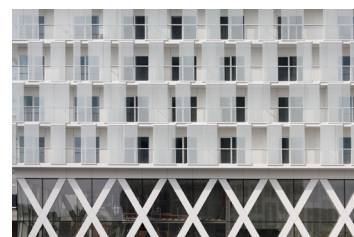
Park Toren - Spoor Noord Antwerpen