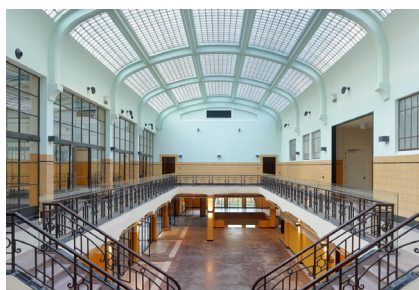
Thor Park - Genk