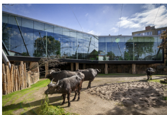
Zoo - Antwerpen