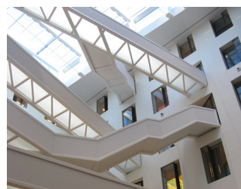
BNP Paribas Fortis, Kanselarij - Brussel